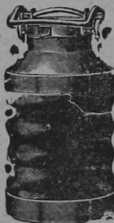
Almacenes al por mayor